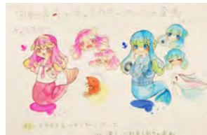
嵯峨美術大学(AO) 合格