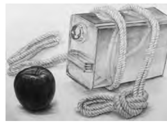
京都市立芸術大学 デザイン 合格再現