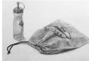
富山大学(推薦) 合格