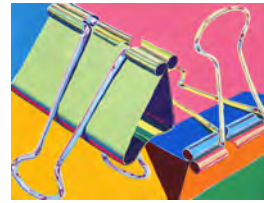
多摩美術大学・武蔵野美術大学 合格