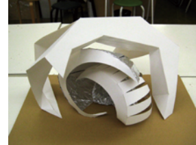
京都市立芸術大学 合格