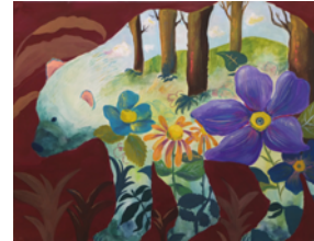
京都市立芸術大学 合格