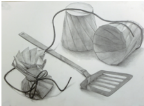
秋田公立美術大学 合格