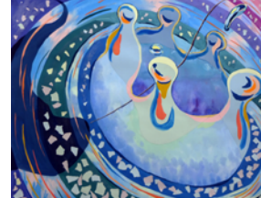
京都市立芸術大学 合格