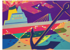
京都市立芸術大学 合格