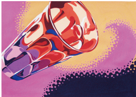
武蔵野美術大学 合格

■研究室生および講習会受講経験者は申込金を免除致します。■講習会終了後、編入学をされる場合は、入学金より申込金を差し引くとともに、次回講習会から申込金は不要です。■授業開始日1週間前を過ぎてからのキャンセルには、返金に応じることができません。